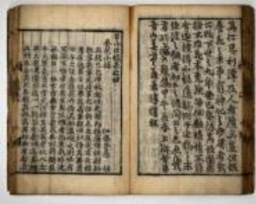
진산세고(晉山世稿) *수록작: 양화소록(養花小錄)