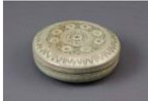
청자상감동화국화문합 (靑磁象嵌銅畫菊花文盒)